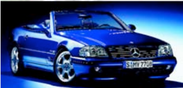
„SL-Edition“ 2000 700Stk