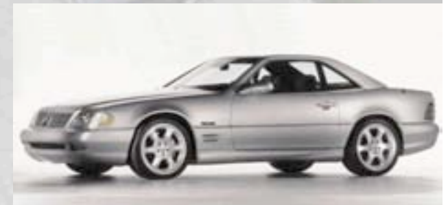
„Mille Miglia“ 2001 13Stk