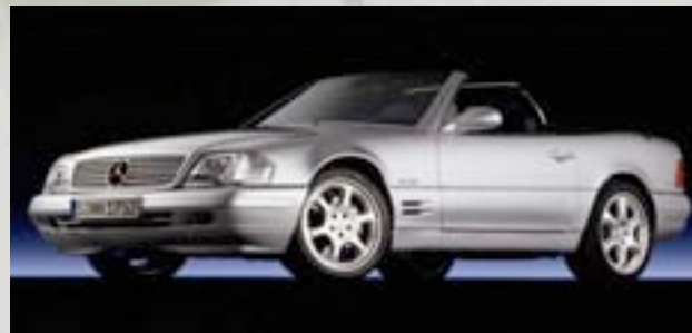
„Mille Miglia“ 2000 12Stk