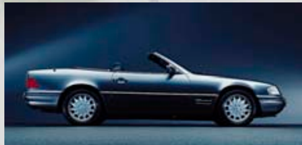
Mopf 1 1996-1997