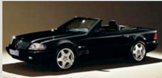
„Final Edition“ 2000 674Stk