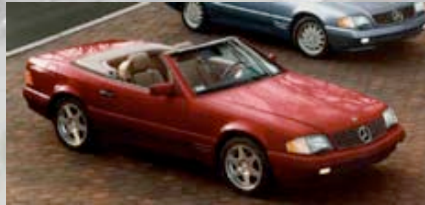
„40th Anniversary Roadster Edition“ 1997 750Stk