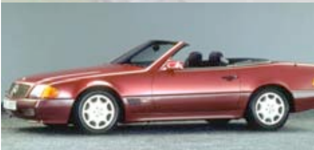
Serie 1989 - 1995