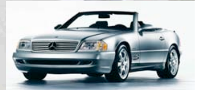
„Silver Arrow Edition“ 2001 USA 1550 Stk