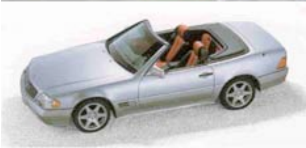
„Mille Miglia“ 1995 630Stk