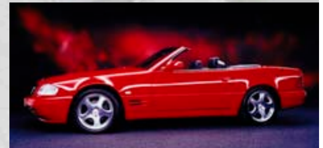
Mopf 2 1998-2001