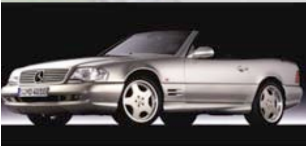
„Mille Miglia“ 1999 12Stk