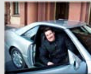
Vorstand Presse und Öffentlichkeits- arbeit