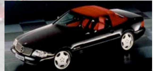
„Special Edition“ 1997 500Stk